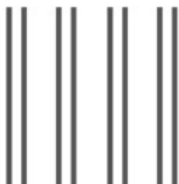
Figura 1. La legge della vicinanza

La componente “costruttiva” teorizzata dalla gestalt, quindi, sembra fondarsi su un processo che, con Matte Blanco, chiamerei “bilogico”: un’interazione tra percezione e simbolizzazione emozionale organizza sia le leggi della gestalt quanto la simbolizzazione amico-nemico del contesto, in una sovrapposizione funzionale delle componenti di realtà che facilitano percezione e simbolizzazione. Pensiamo, ad esempio, alla categoria emozionale e percettiva “vicinanza”: