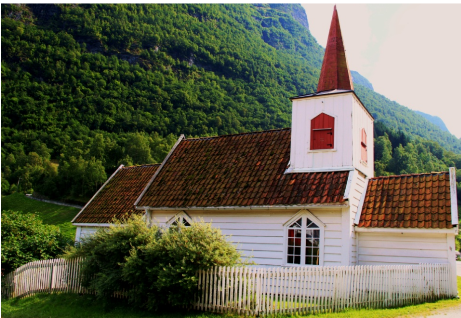
Fig. 21 - La piccola stavkirke di Undredal

Lo spazio anzi e la confusione categoriale sono importanti, necessari per il cambiamento