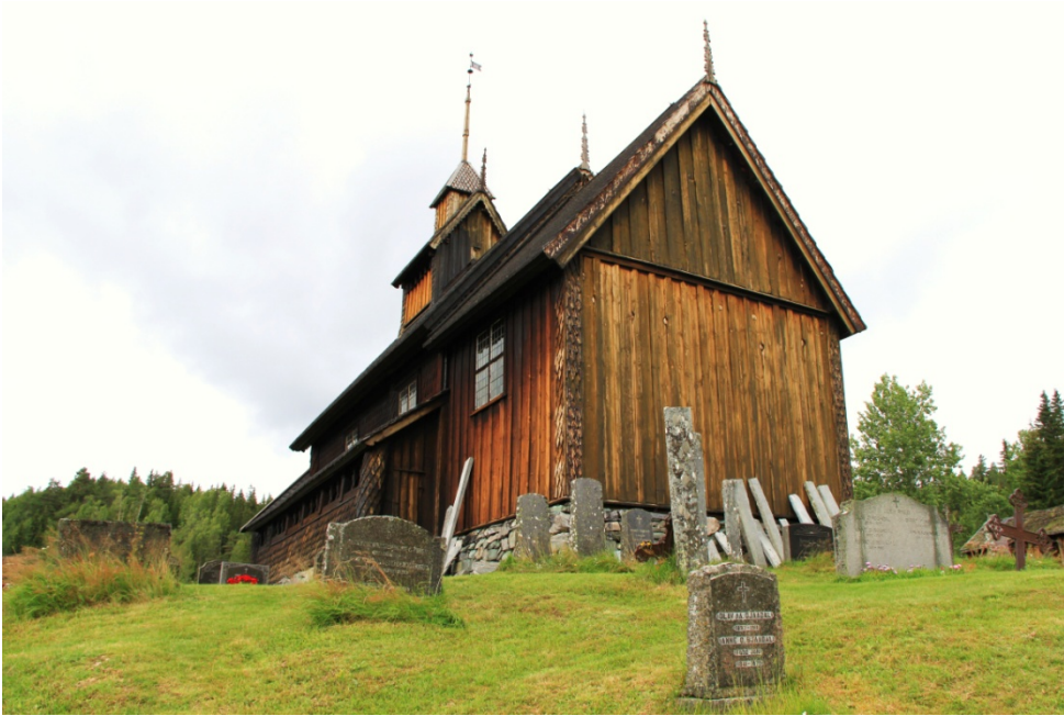
Fig. 20 - La stavkirke di Eidsborg