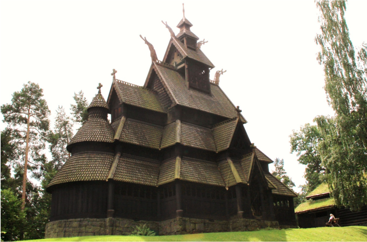
Fig. 3 - La stavkirke di Gol, conservata al Norsk Folkemuseum.

Nella fig. 3 è presentata la stavkirke originaria di Gol, una cittadina di cinquemila abitanti situata nella contea di Buskerud, all'estremo nord della valle di Numedal, in una zona ricca di stavkirker ancora oggi visitabili. La stavkirke di Gol, peraltro, versava in cattive condizioni ed era in uno stato di completo abbandono quando, alla fine del XIX secolo, fu salvata dalla completa distruzione da Oscar I (del casato di Bernadotte), Re di Svezia e Norvegia 3 che, nel 1884, la fece restaurare e porre nell'attuale Norsk Folkemuseum, assieme alla sua collezione privata di antichi edifici norvegesi. Sono visibili le stav , poggiate su una base di pietra che funge da sostegno e isolamento dal suolo della struttura di legno, e che costituì la fondamentale innovazione tecnologica che, impedendo ai pali di marcire, ha conservato queste chiese a differenza di quelle che le precedettero, con i pali disposti allo stesso modo ma infissi nella terra. Le stav visibili nella foto reggono il tetto del deambulatorio o portico, che circonda l'intero edificio; le stav che reggono la chiesa vera e propria sono visibili all'interno.