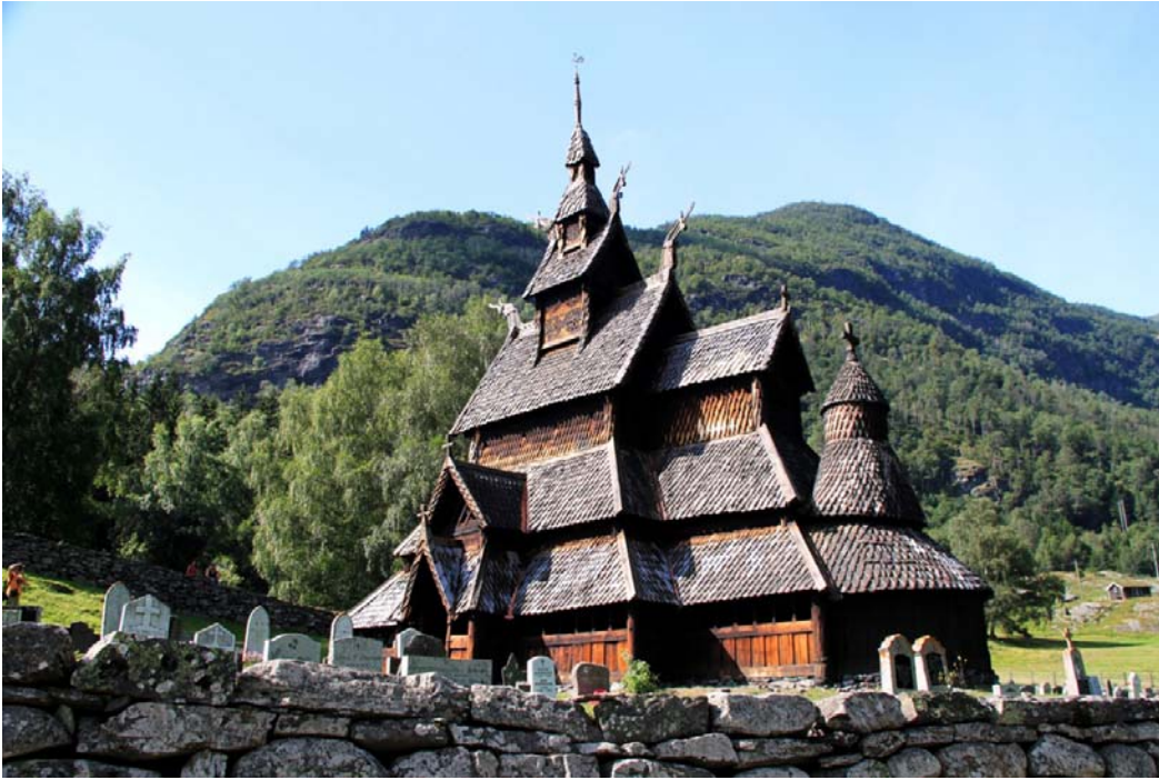
Fig. 16 - Stavkirke di Borgund