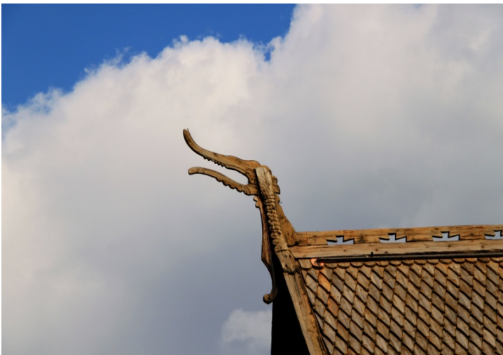
Fig. 17 - Drago della stavkirke di Lom