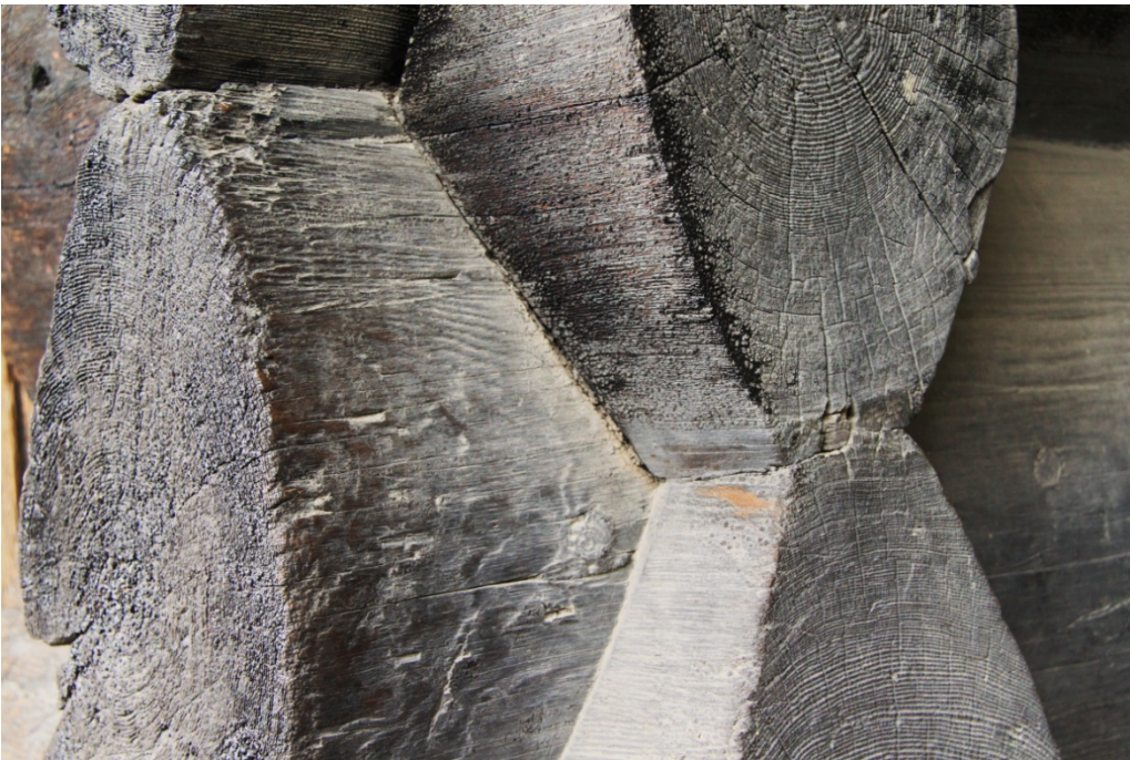
Fig. 2 - Il particolare di una fattoria medioevale sita nello stesso Norsk Folkemuseum. Si può vedere l'incastro dei pali orizzontali