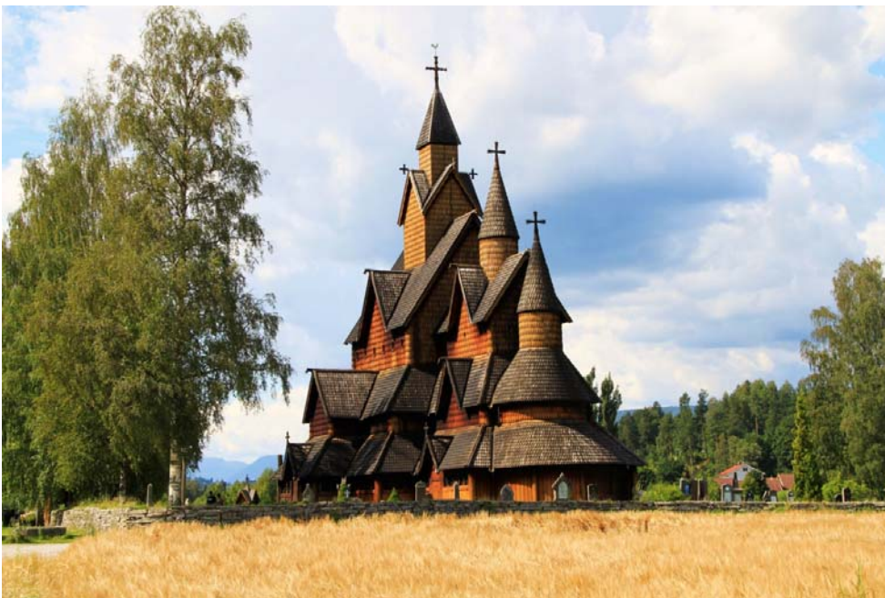
Fig. 19 - La stavkirke di Heddal

Questa continuità e questo sentimento di estraneamento si possono rivivere visitando le stavkirker più grandi, come nella scoperta delle più piccole, sparse entro valli isolate, silenziose. Si vive così l'emozione di Heddal, la grande "cattedrale" delle stavkirker, posta oggi nelle vicinanze di una moderna strada di scorrimento, o l'entusiasmo per la piccola Eidsborg, che si raggiunge percorrendo una tortuosa stradina spopolata, per giungere ad un minuscolo borgo tra i monti, vicino ad un lago. La più piccola delle stavkirker si trova a Undredal: una piccola vallata remota, che si diparte da una delle tante diramazioni del Sognfjord. Una vallata ove si produce un celebre formaggio norvegese, a base di latte di capra, il geitost , immancabile sulle tavole della prima colazione norvegese. Una vallata raggiungibile solo per mare, sino al 1991.