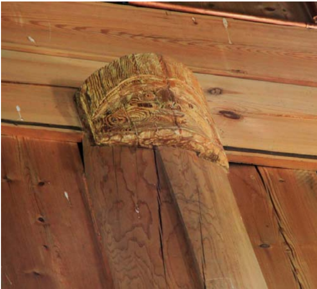
Fig. 12 – Maschera situata nella stavkirke di Heddal

Ma immagini rievocanti miti e riti pagani si trovano anche nelle magnifiche serrature dei portali, ricche di simbolismi dove spesso, nei girali di ferro battuto, alle teste di drago si associano piccole teste umane, come in una serratura della stavkirke di Reinli, nel Valdres. La giovane custode della stavkirke, che poi ci dirà di essere una studentessa di storia dell'arte, ce le andava indicando pronunciando, timida, il nome di Odino e di Thor. Per altro stupendosi che noi sembravamo riconoscerli, poiché si aspettava che fossimo presi dalla sola, imperante, mitologia greco-romana, assimilata per altro al mondo cristiano, entro l'idea di una incompatibilità di mondi, ove il "vittorioso" non può che ignorare e negare ottusamente il "perdente". Più tardi, nella stavkirke di Eidsborg la signora che ce la illustra, ricordando Odino le cui tracce sono state trovate nelle fondamenta, dirà che in quei luoghi è stata dura far attecchire il cristianesimo. Le abbiamo allora raccontato della chiesa di San Giovanale, a Orvieto, e del precedente tempio dell'etrusco Tinia assimilato al romano Giove: fortunatamente, anche noi abbiamo un fertile e intricato passato pagano, anche se lei ce ne attribuiva uno molto più lineare. Ci andavamo accorgendo che, nell'ottica "norvegese", la cultura con cui venivamo identificati appariva come la cultura pagana agli occhi dell'estensore della tabella di San Giovanale: continua e progressiva, dall'antichità greco-romana al cristianesimo.