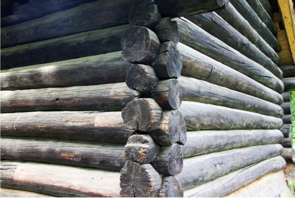
Fig. 1 - Le pareti di una fattoria medioevale, costruita con il metodo laft, situata nel Norsk Folkemuseum di Bygdoy (Oslo).