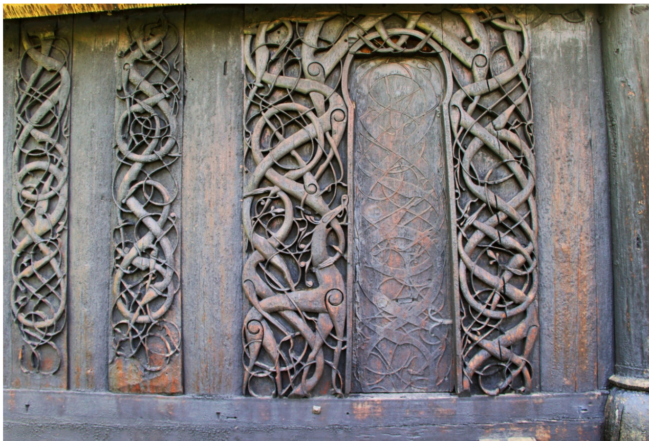
Fig. 14 – Stavkirke di Urnes: decorazione del portale appartenente alla stavkirke precedente all'attuale

Ci sono poi le decorazioni lignee delle stavkirke, specie quelle dei magnifici portali di ingresso. Ricordiamo, tra le altre, le celebri decorazioni che si trovano sulla parete esterna, settentrionale, della stavkirke di Urnes, la più antica tra quelle rimaste, costruita nel 1130 circa; decorazioni che ornavano l'ingresso della chiesa precedente, dell'XI secolo.