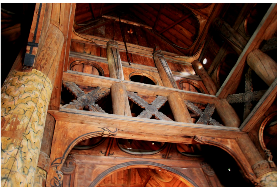
Fig. 5 – Interno della stavkirke di Gol, conservata al Norsk Folkemuseum.

Diamo un rapido sguardo all'interno. Le stav si ergono agli angoli della chiesa, come anche a delimitare vere e proprie "navate" in più d'una di queste chiese, (vedi ad esempio a Gol, come pure nelle chiese delle foto che seguono, quella di Hopperstad e quella di Burgund), contribuendo all'impressione di entrare in una "foresta sacra", cara al paganesimo medioevale di quei luoghi.