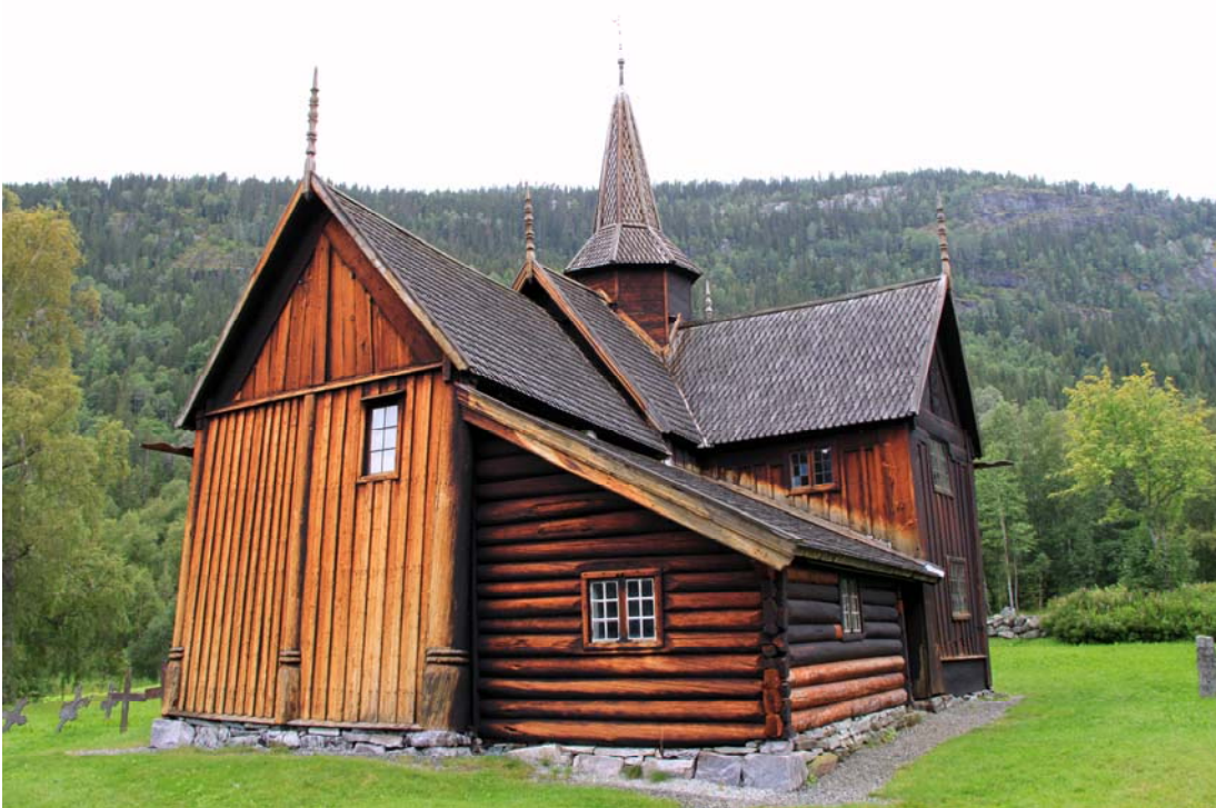
Fig. 4 - La stavkirke di Nore, nella vallata del Numedal

Nella fig. 4 sono ben visibili all'esterno le stav che reggono la parte terminale della navata centrale, dove un tempo c'era il coro, ora perso. La parete terminale della navata, costruita con il metodo stav , è fatta del legno di recupero del coro. E' anche visibile una parte della stavkirke aggiunta più tardi, la sacrestia; questa parte è stata costruita con il metodo laft , sicuramente meno elegante anche per la perdita di quello slancio che il metodo stav conferisce.