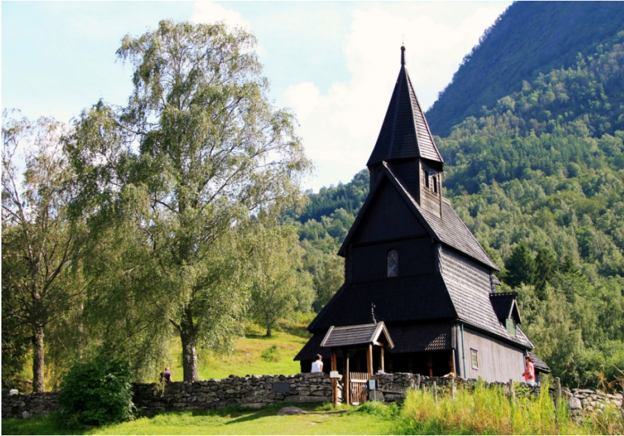
Fig. 15 – La stavkirke di Urnes

Qualche citazione, a proposito del portale di Urnes il cui intaglio fu eseguito, probabilmente, attorno al 1050.