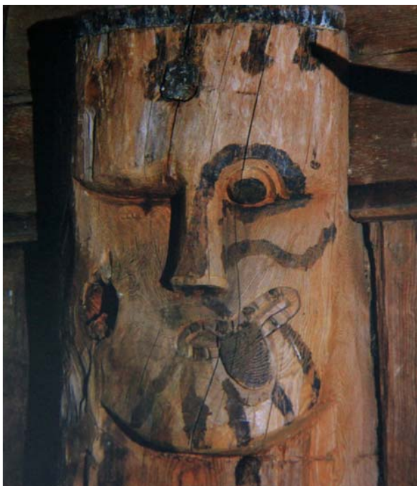
Fig. 11 – Maschera situata nella stavkirke di Hegge

In più di una stavkirke sono ancora oggi visibili una serie di maschere, scolpite alla sommità delle travi montanti ( stav ). Nella stavkirke di Hegge, situata nel Valdres, queste maschere sono state occultate agli usuali frequentatori della chiesa, ancor oggi luogo di culto per gli abitanti della zona, da un soffitto che "taglia" a tre quarti i montanti stessi e nasconde così anche la parte interna del tetto. Si tratta di maschere suggestive e interessanti, una delle quali mostra un viso grottesco con un solo occhio; al posto dell'altro occhio vi è una ferita.