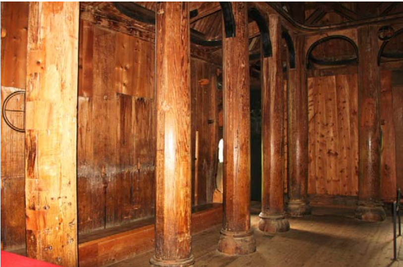
Fig. 6 e 7 - L'interno della stavkirke di Hopperstad, nella zona del Sognefjord.