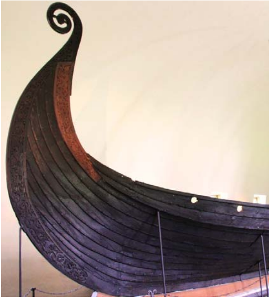
Fig. 9 - La nave Oseberg costruita nel 890 d.c. e conservata al museo delle navi vichinghe di Bygdoy (Oslo)

Grandi costruttori, i carpentieri costruirono le stavkirker in maniera così efficace da far arrivare a noi, come abbiamo visto, alcuni esemplari di queste costruzioni capaci di resistere alle avversità meteorologiche e all'incuria degli abitanti. Quasi sempre senza contrafforti esterni, usualmente utilizzati per compensare le spinte verso il basso nelle chiese in pietra, tranne il particolare caso delle tre sopravvissute del cosiddetto tipo di Møre, le stavkirker hanno un complesso sistema di rinforzi interni, fondati soprattutto sulle "mensole": strutture angolari ricavate da quella parte dell'albero in cui c'è l'intersezione dei grandi rami dell'albero con il tronco o quella in cui il tronco si allarga alla base con le grandi radici emergenti da terra. Strutture che, grazie all'andamento delle fibre lignee in quei punti specifici dell'albero, naturalmente incurvate, mostrano grande resistenza. Si tratta di strutture lignee utilizzate anche nella costruzione delle navi vichinghe. Vi è quindi una stretta parentela tra il costruttore navale e il capomastro della stavkirke.