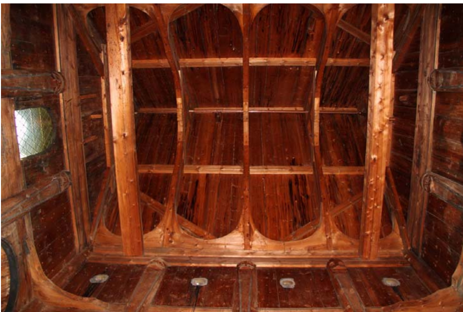
Fig. 10 – Il sostegno del tetto nella stavkirke di Borgund. Le mensole sono quelle forme arcuate che collegano i puntoni della capriata e li fissano alla loro base. La forma arcuata è ottenuta dall'unione di due mensole. Sono visibili i mascheroni che ornano la parte terminale dei montanti o stav, come nella fig. 4.

Grandi costruttori, i carpentieri costruirono le stavkirker in maniera così efficace da far arrivare a noi, come abbiamo visto, alcuni esemplari di queste costruzioni capaci di resistere alle avversità meteorologiche e all'incuria degli abitanti. Quasi sempre senza contrafforti esterni, usualmente utilizzati per compensare le spinte verso il basso nelle chiese in pietra, tranne il particolare caso delle tre sopravvissute del cosiddetto tipo di Møre, le stavkirker hanno un complesso sistema di rinforzi interni, fondati soprattutto sulle "mensole": strutture angolari ricavate da quella parte dell'albero in cui c'è l'intersezione dei grandi rami dell'albero con il tronco o quella in cui il tronco si allarga alla base con le grandi radici emergenti da terra. Strutture che, grazie all'andamento delle fibre lignee in quei punti specifici dell'albero, naturalmente incurvate, mostrano grande resistenza. Si tratta di strutture lignee utilizzate anche nella costruzione delle navi vichinghe. Vi è quindi una stretta parentela tra il costruttore navale e il capomastro della stavkirke.