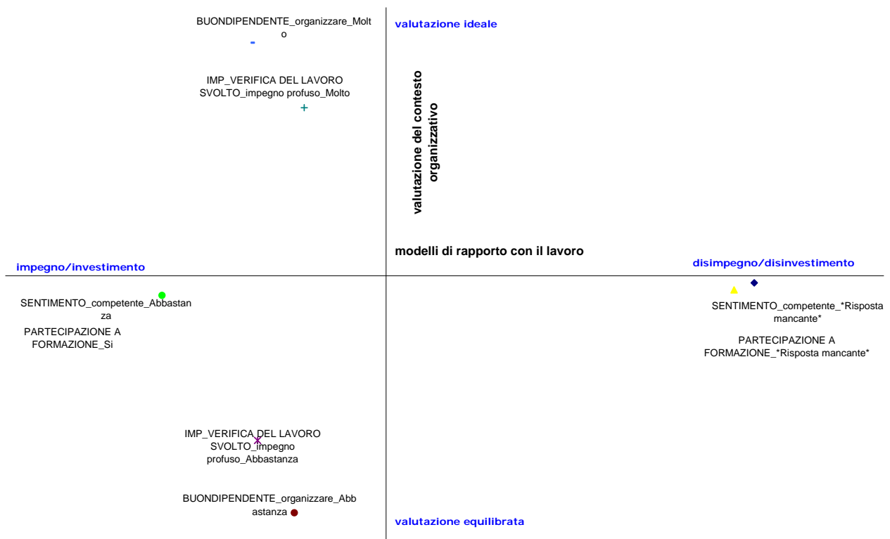
Figura 2. Analisi delle Corrispondenze multiple sulle variabili di contesto